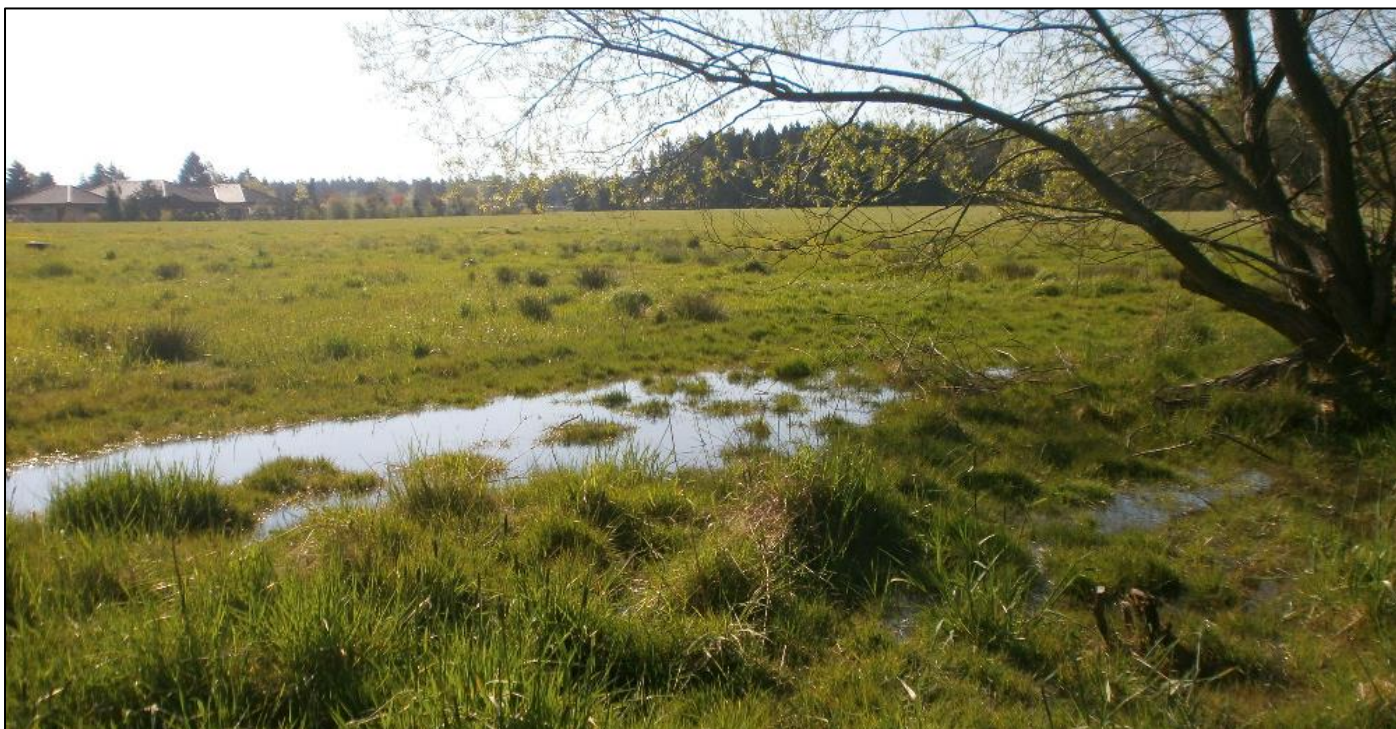
Mokřad v lokalitě V Jamách.

budoucná může rychle změnit, jak to vidíme v celých rozsáhlých regionech republiky. Proto je nejen pro milovníky přírody žádoucí, taková místa ochránit, ale je to existenční nutnost pro všechny. Těžko si představit, že jak Svojetice, tak všechny okolní obce prostě "odněkad" vodu přivedou. Není voda ? Ať se někdo postará ! To je cesta do klimatické krize, kterou si možná mnoho lidí neumí ani představit.